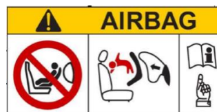
Štítko upozorňujúci na nebezpečenstvo poranenia airbagom